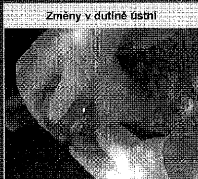
Změny v dutině ústní

V případě zjištění výše uvedených příznaků ihned kontaktujte soukromého veterinárního lékaře nebo příslušnou krajskou veterinární správu.